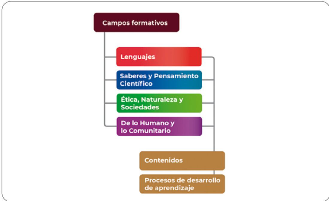
Elementos curriculares de los Programas Sintéticos

Representan recorridos o rutas posibles que dan cuenta de las formas en las que niñas, niños y adolescentes se apropian de aprendizajes que les permiten comprender el mundo que les rodea e intervenir en distintas situaciones.