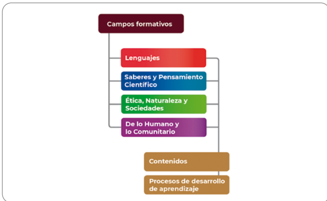
Elementos curriculares de los Programas Sintéticos

Representan recorridos o rutas posibles que dan cuenta de las formas en las que niñas, niños y adolescentes se apropian de aprendizajes que les permiten comprender el mundo que les rodea e intervenir en distintas situaciones.