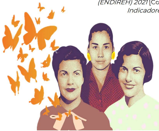
Las mariposas: Patria, María Teresa y Minerva Mirabal

Fuentes: INEGI. (2022, 30 de agosto). Encuesta Nacional sobre la dinámica de las relaciones en los hogares (ENDIREH) 2021 [Comunicado de prensa núm. 485/22]. pp.1-36. INMUJERES. (2022). Indicadores Básicos sobre la Violencia contra las Mujeres . Autor.