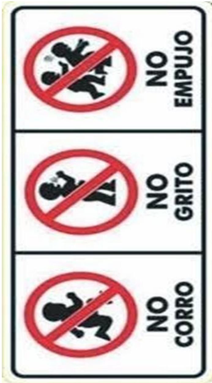
Figura 9. (s.f.). Señalamientos. (Imagen)