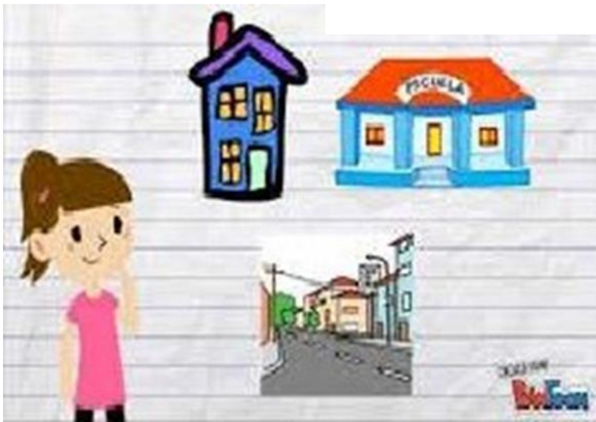
Figura 10. Pinterest-México. (s.f.). Casas.(Imagen) Recuperada de https://www.pinterest.com.mx/pin/571886852686912517/?nic_v1=1aI9oESJzA0dAIWGmVaqCEHOSbITw3oVc0E3B6i9jqN8w1vCriG%2F3z9d9igxrXhK